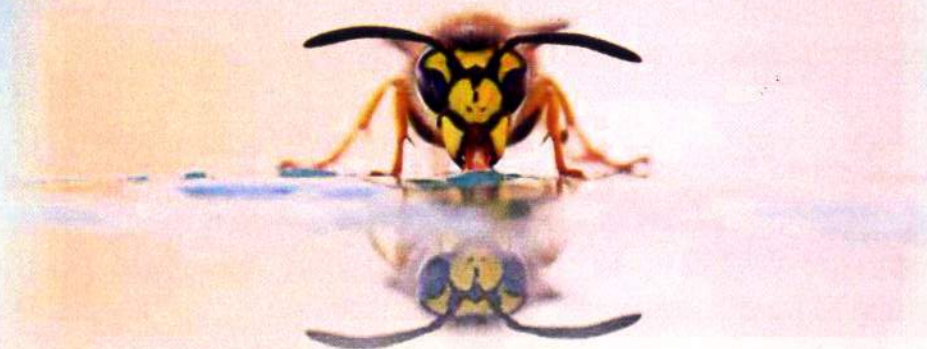
Foto ganadora, autor: Jose Valero Sánchez "V Concurso Fotográfico Jornadas de Medio Ambiente"

El Ayuntamiento de San Vicente del Raspeig con la colaboración del C.I.P.F.P. CANASTELL, dentro de sus actividades relacionadas con el Medio Ambiente y la Salud, convoca de nuevo este concurso fotográfico, cuya pretensión es fomentar entre los participantes y quienes vean las imágenes, a partir de la creatividad plástica y artística, actitudes positivas, de concienciación, sensibilización o denuncia, sobre el MEDIO AMBIENTE y la SALUD.